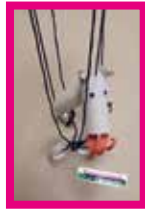
Klorollenmarionette weiter gehts ...