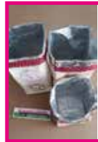
Tetra Pak Körbchen weiter gehts ...